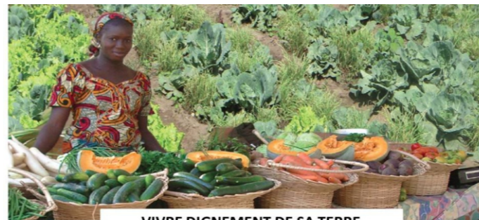
VIVRE DIGNEMENT DE SA TERRE